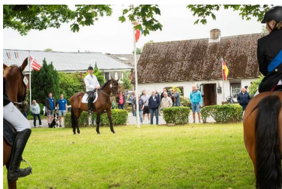
Antreten unter den Eichen

Termin: Am Sonntag, dem 23. Juni 2024 findet das Kinderringreiten in Ostrohe statt. Wir freuen uns über zahlreiche Zuschauer. Für das leibliche Wohl ist gesorgt.