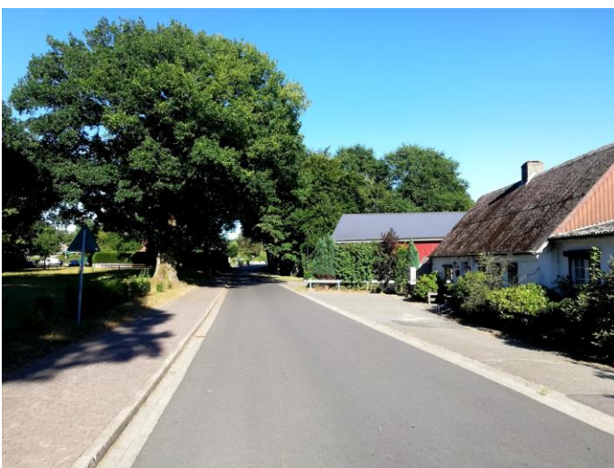
Ehemalige Agentur (heute Wohnhaus) gegenüber dem ehemaligen Kleinbahnhof