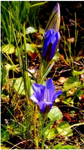
Lungenenzian – Bestand erloschen