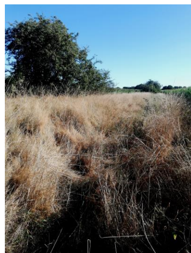
Bahndammtrasse - westlich vom Nordweg