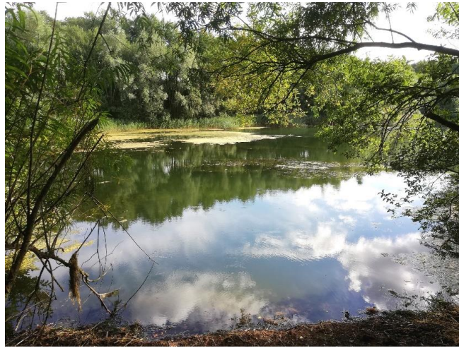
Biotop-ehemalige Kiesgrube am Brombeer Weg/ Twietweg