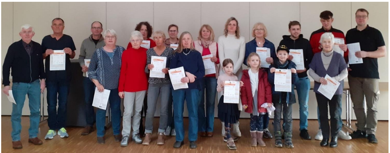
Text und Foto: Silke Kolbe

Die Absolventen mit der 25. und 40. Wiederholung erhielten jeweils ein "Dankeschön" in Form einer Blumenampel.