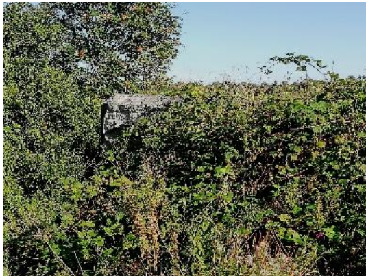
Brückenwiderlager im "Dornröschenschlaf"