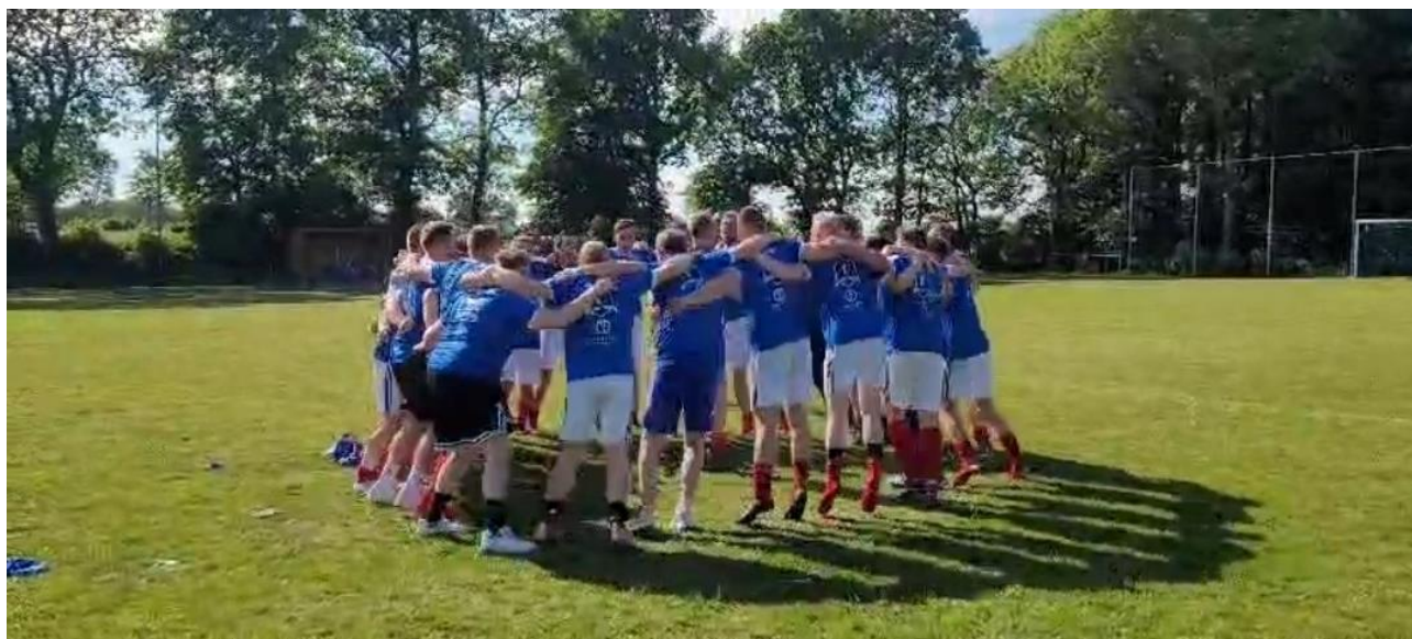
Die Mannschaft tanzt nach dem Spiel den Meistertanz