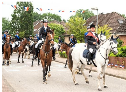
Umzug durch die Gemeinde